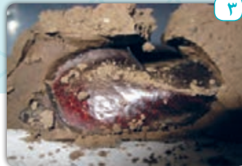
٣- الْجَفَافُ : خشك