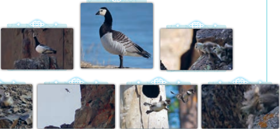
۱- الْمُرْعَبُ: ترسناک

پرنده‌ای وجود دارد که «برناکل» ..... [او] لانه‌اش را بر فراز کوه‌هایی بلند، دور از شکارچیان ..... و هنگامی که جوجه‌هایش ..... از آنها می‌خواهد از لانه بلندشان بپرند. جوجه‌ها ..... خودشان را از کوهی که بلندای آن به بیش از ..... متر می‌رسد، می‌اندازند. و چند بار با صخره‌ها ..... . پدر و مادر، پایین کوه چشم به راه می‌شوند و به پیشواز جوجه‌هایشان می‌روند. افتادن جوجه‌ها صحنه‌ای بسیار ترسناک است. ولی هیچ گریزی از آن نیست؛ زیرا بخشی از زندگی ..... شان است.